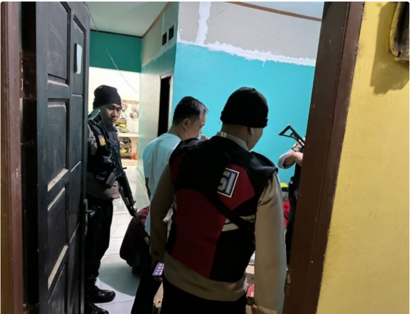
Tampak aparat kepolisian Morowali lakukan razia

MOROWALI, Sulawesi Tengah- Kepolisian Resort (Polres) Morowali tidak Panas Panas Tai Ayam, merespon cepat dan menindak tegas keluhan dari para tokoh masyarakat terkait peredaran Minuman Keras (Miras) yang selama ini cukup