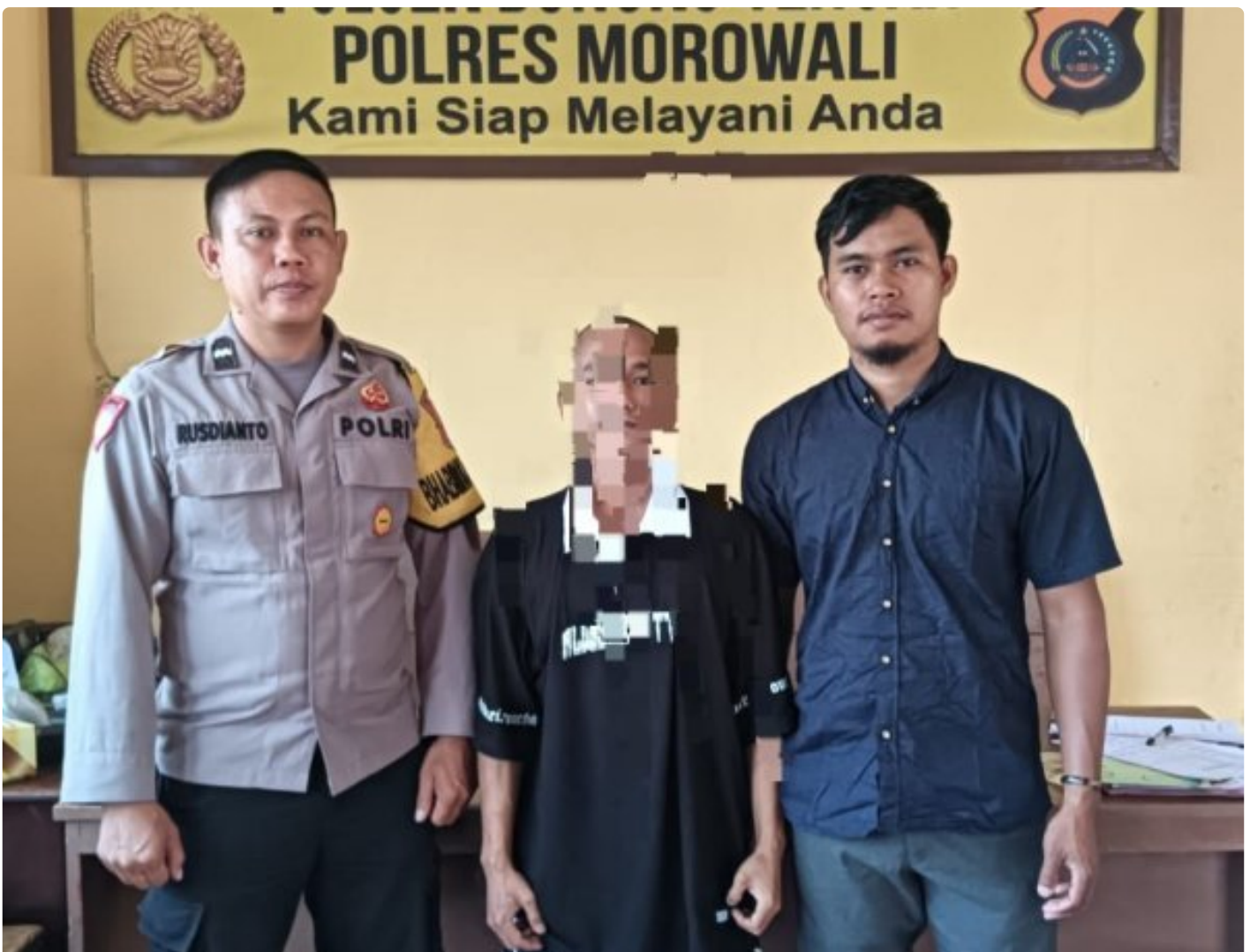
Aparat Polsek Bungku Tengah Berhasil Tangkap Pelaku Curanmor

MOROWALI, Sulawesi Tengah- Pada Hari Sabtu 5 Oktober 2024 Sekitar Pukul 18.30 Wita Kepolisian Sektor (Polsek) Bungku Tengah Polres Morowali, berhasil mengungkap kasus pencurian kendaraan bermotor (curanmor) yang terjadi di