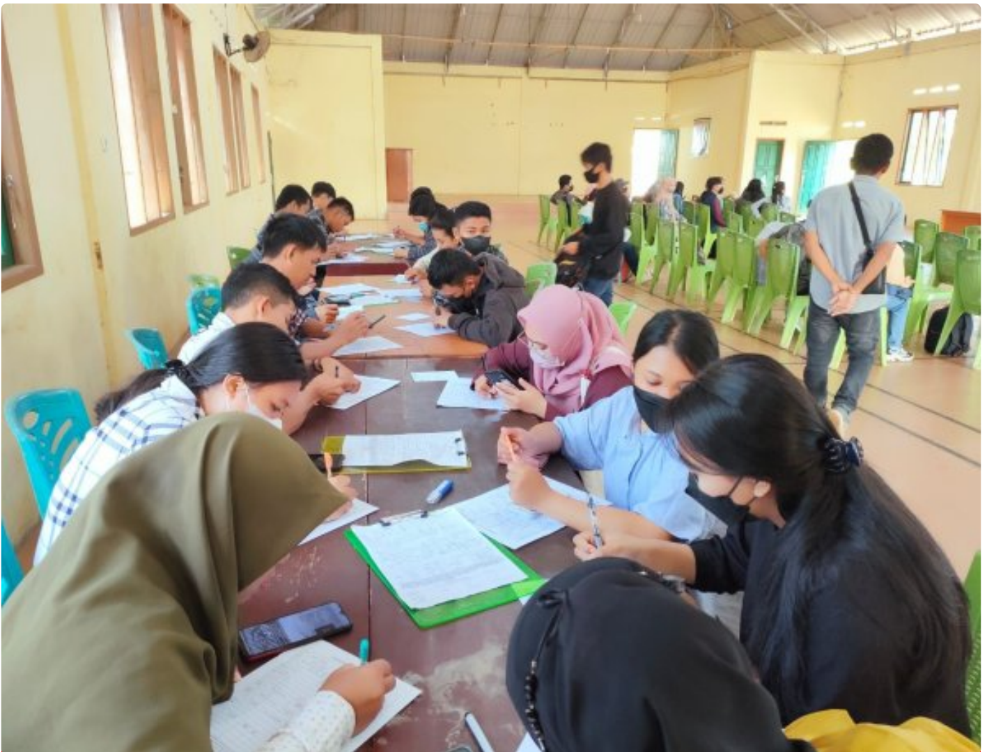
Tampak Antusias Pencaker Ikuti Job fair yang digelar PT GNI di Desa Molino

MOLINO, Morut Sulteng- PT Gunbuster Nickel Industry (GNI) secara beruntun melakukan Job Fair atau perekrutan langsung di sejumlah Desa Kecamatan Petasia Timur, Kabupaten Morowali Utara (Morut).